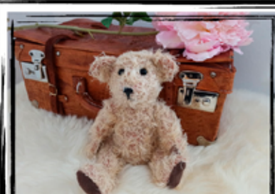
ANTIIKKINALLE - VANHANAJAN TONTTU 30.11 - 7.12.2024