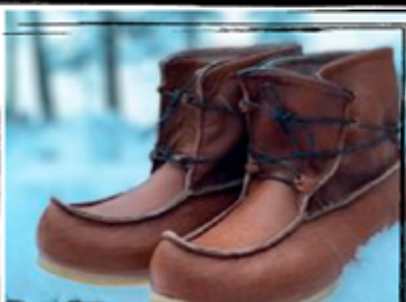
LAPIKAS- JA SUPIKASKURSSI 15.11.2024 - 1.12.2024

SULAUTUNUT TAIVALCOSKEN OSUUSPANKKI Hallitus