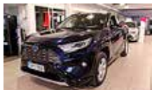
TOYOTA RAV4 2,5 Hybrid Style vm. 2020

Katso huolettomat vaihtautoamme osoitteesta: toyota.fi/vaihtoautot