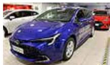
TOYOTA COROLLA Touring Sports 1,8 Hybrid Launch Edition vm. 2023