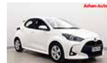
TOYOTA YARIS 1,5 Hybrid Active 1-om, huippusiisti, atvillinen vm. 2022