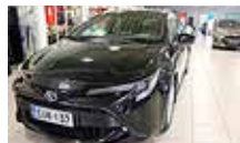
TOYOTA COROLLA Touring Sports 1,8 Hybrid Prestige Edition vm. 2022