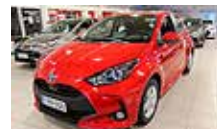
TOYOTA YARIS 1,5 Hybrid Active Plus-paketilla vm. 2023