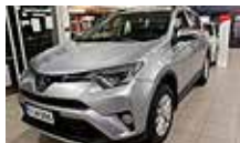
TOYOTA RAV4 2,5 FWD Hybrid Edition Vetokoukku vm. 2017